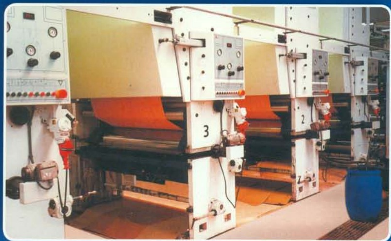
IMPRESIÓN DE PAPELES DECORATIVE PAPERS PRINTING