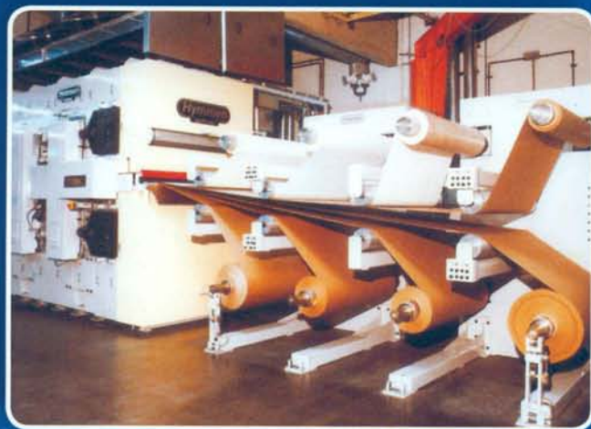
LAMINADORA HYMMEN HYMMEN PRESS