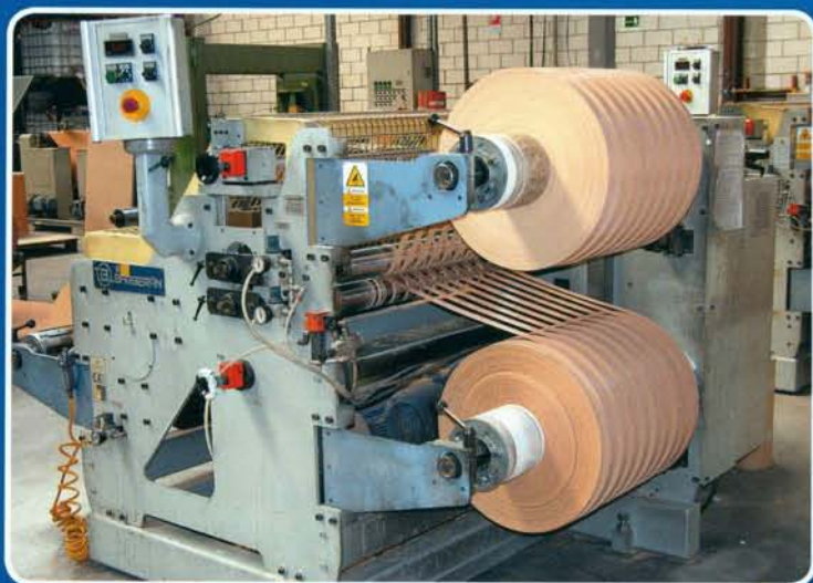
PRODUCCIÓN DE CANTOS EDGE BANDING PRODUCTION