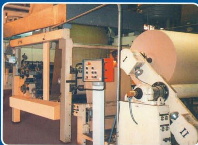
IMPREGNACIÓN DE PAPELES IMPREGNATED PAPERS